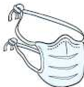
Máscara Cirúrgica (profissional)