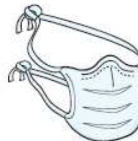
Máscara Cirúrgica (paciente durante o transporte)