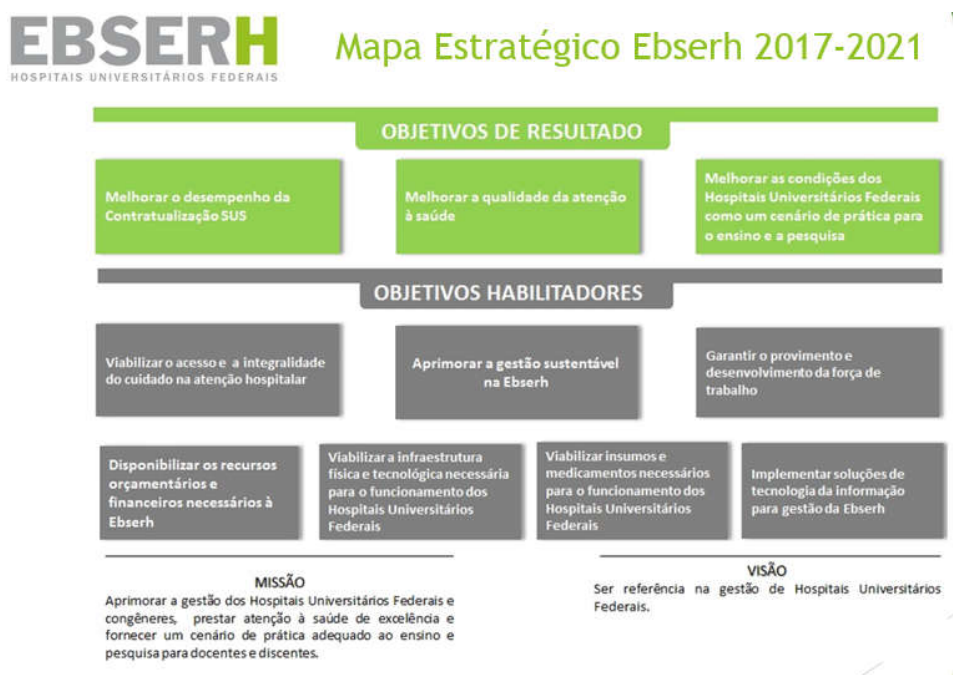
Figura 2 – Mapa Estratégico da Ebserh 2017 - 2021