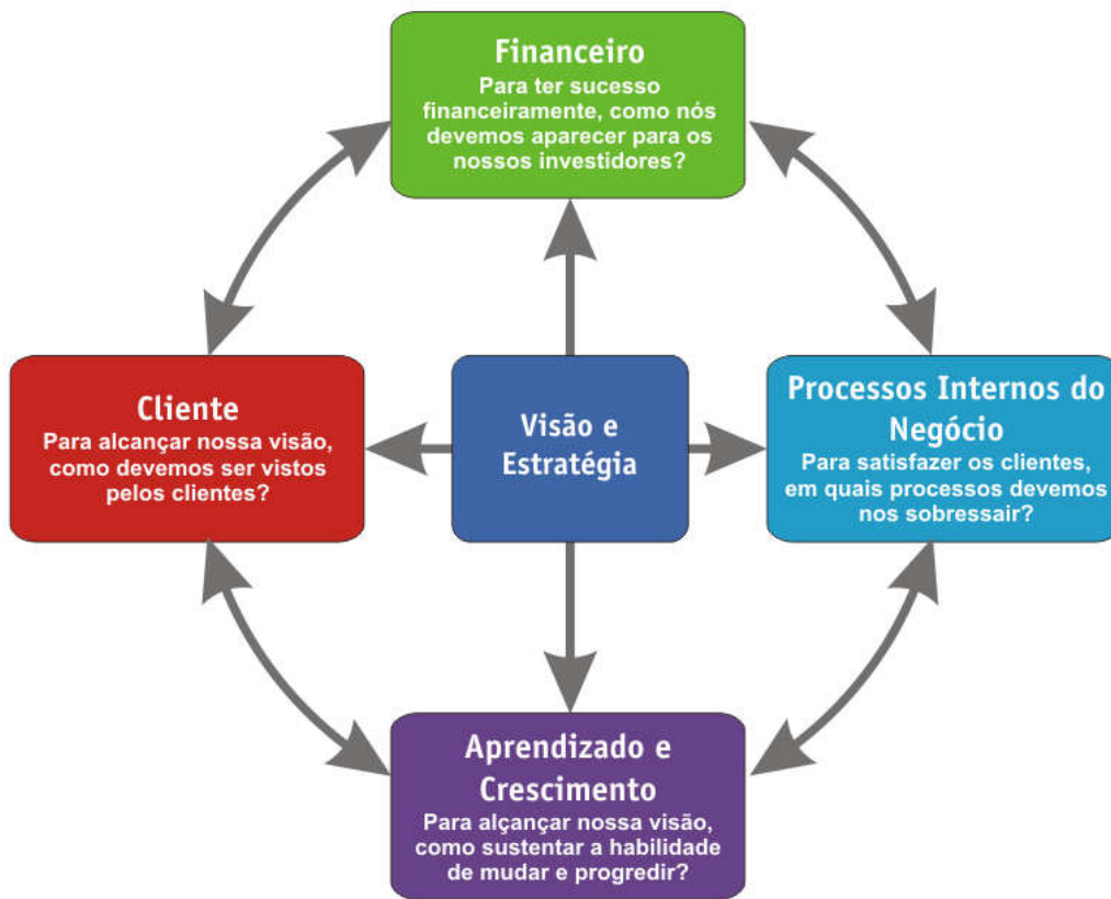
Figura 5 – Perspectivas Balanced Scorecard

Concebido por Kaplan e Norton, o Balanced Scorecard – BSC oferece um método simples para articular a estratégia e monitorar o progresso das metas estabelecidas. O instrumento objetiva medir e monitorar a estratégia em ação, por meio de diferentes perspectivas: financeira, cliente, processos internos e aprendizado e crescimento. Por meio dessa dimensão multifatorial, o BSC consegue comunicar a estratégia de forma ampla, buscando fortalecer seu entendimento.