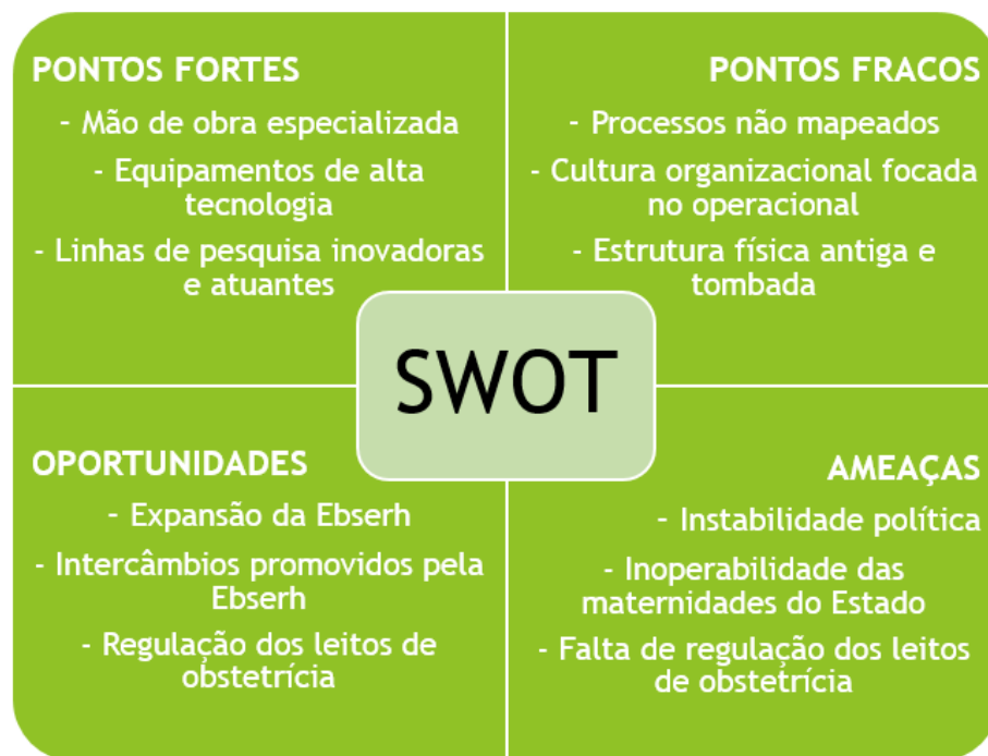
Figura 1 – Representação gráfica da análise SWOT