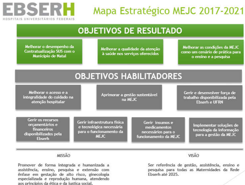
Figura 3 – Mapa Estratégico da MEJC 2017 - 2021