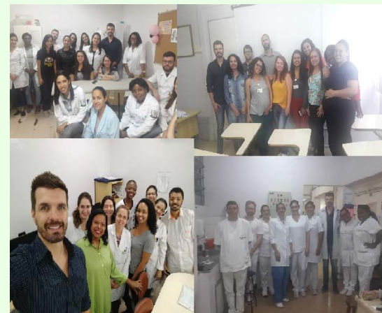
Roda de Conversa Novembro Azul: HU Dom Bosco, Santa Catarina e CAPS.

O evento contou com 136 ouvintes e a participação dos trabalhadores foi fundamental para o sucesso do evento!