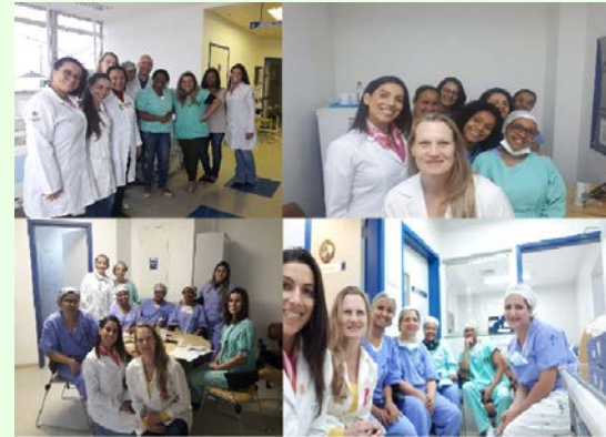
Roda de Conversa Outubro Rosa: HU Dom Bosco

O evento foi um sucesso, contemplando vários setores do HU Dom Bosco (Centro Cirúrgico, Hemodiálise, Endoscopia, CME, Hospital-Dia) e o evento da beleza previsto para ir até às 14 horas foi estendido até 17 horas pela grande procura.