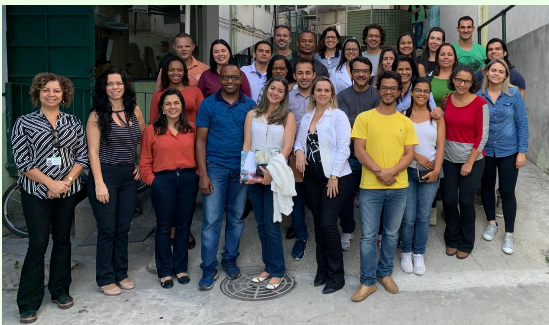
Fotografia em 03/07/2019: Posse da CIPA Gestão 2019-2020 (HU Santa Catarina)